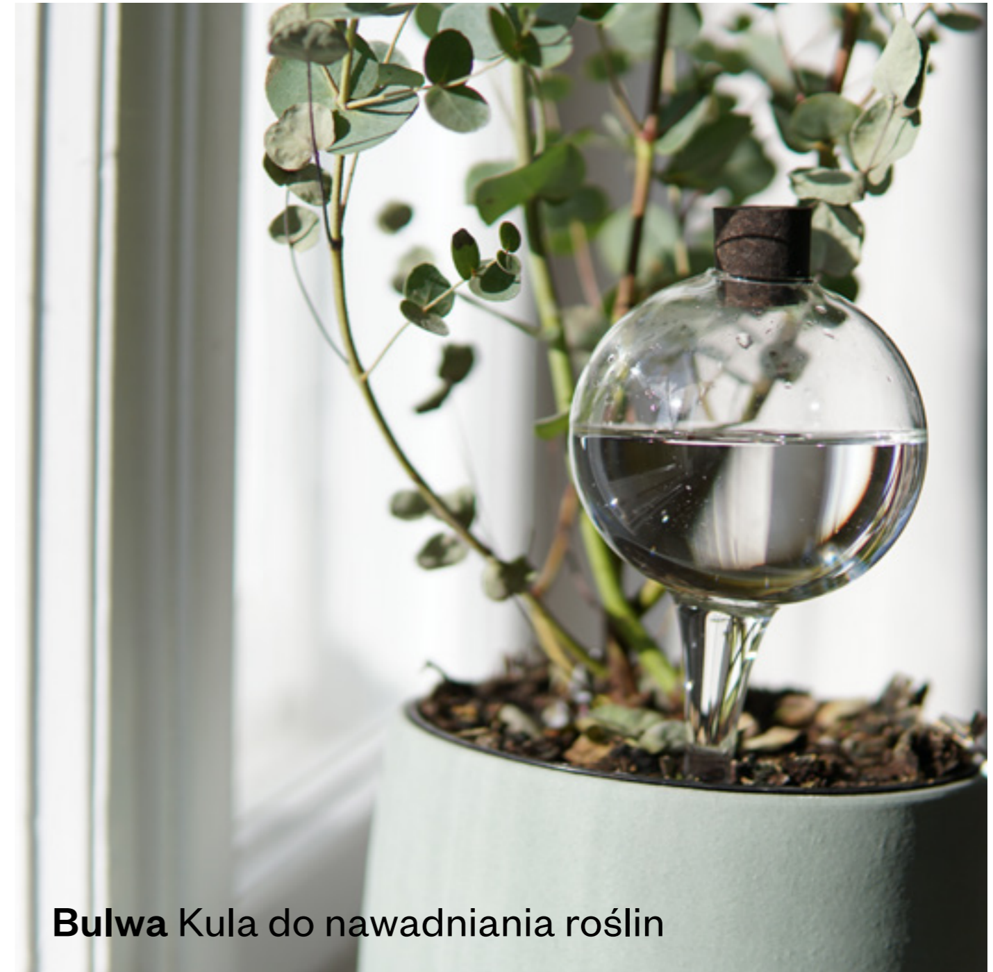
Bulwa Kula do nawadniania roślin