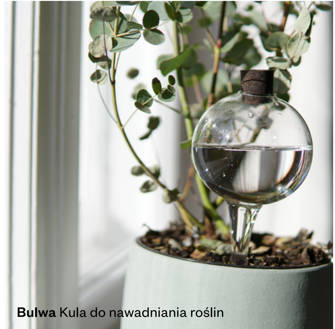
Bulwa Kula do nawadniania roślin