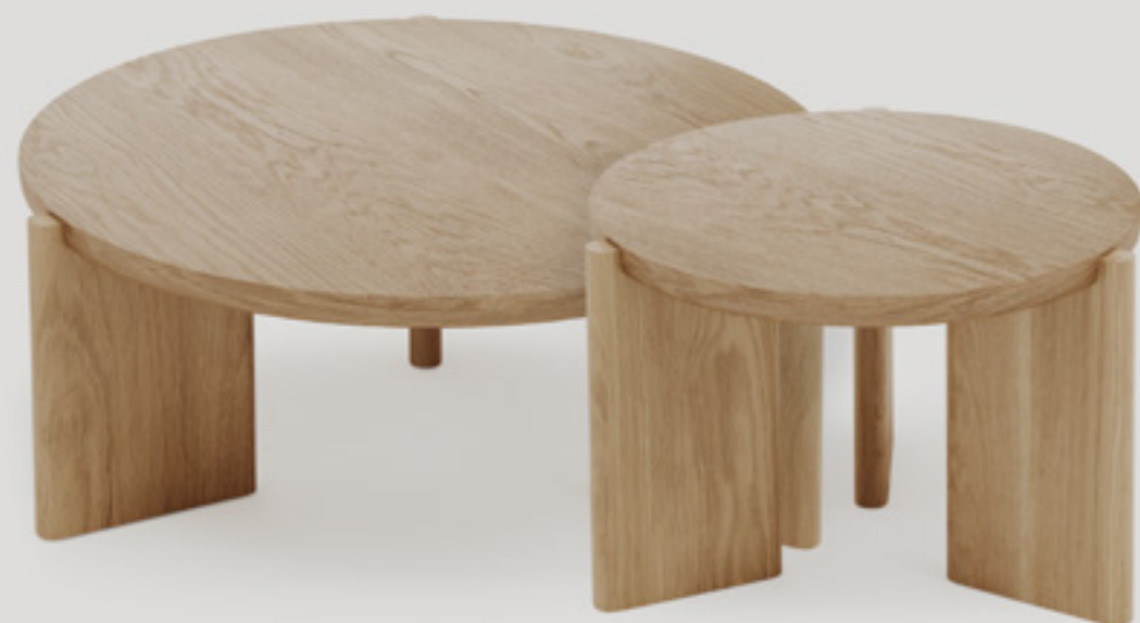
Huba Stolik kawowy